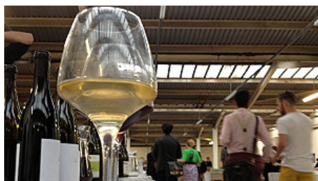
El sabor del vino natural es muy distinto del del vino convencional.

"Es el futuro" finaliza por su parte el también sommelier y comerciante de vinos, Constanzo Scala, "veo a cada vez más gente interesada. Este vino tiene otro valor de marketing".